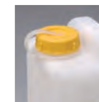
カラーキャップ取付例