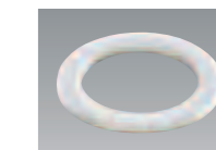
バックリン(ポリエチレン発泡体)