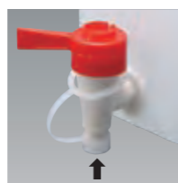
液ダレ防止先端キャップ (コックは取り外しできません)

■通常在庫品 ■3~5日 ■7~10日 ■材質/容器・コック：ポリエチレン(PE)、ポリプロピレン(PP)、Oリング：バイトン(FKM) ■製造国/日本 ※寸法には許容差があります。(単位mm)