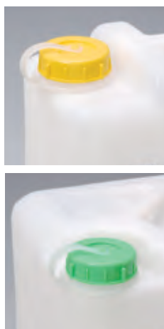
ツル付カラーキャップ取付例